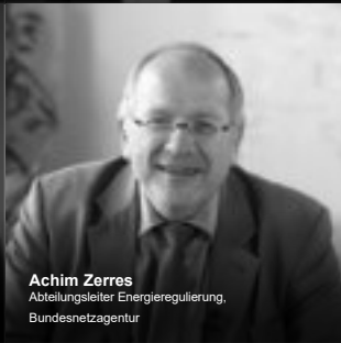
Achim Zerres Abteilungsleiter Energieregulierung, Bundesnetzagentur