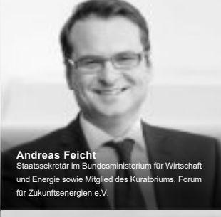
Andreas Feicht Staatssekretär im Bundesministerium für Wirtschaft und Energie sowie Mitglied des Kuratoriums, Forum für Zukunftsenergien e.V.