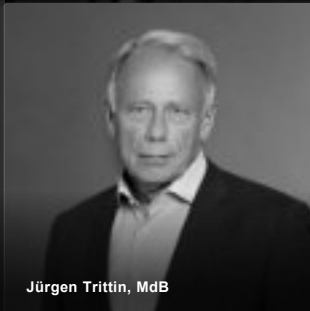
Jürgen Trittin, MdB