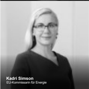
Kadri Simson EU-Kommissarin für Energie