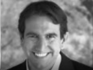
Andreas Jung, MdB Stellvertretender Vorsitzender der CDU/CSU-Bundtagsfraktion