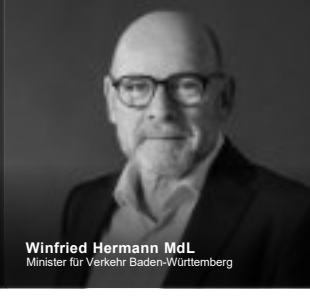
Winfried Hermann Mdl Minister für Verkehr Baden-Württemberg