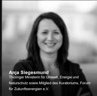
Anja Siegesmund Thüringer Ministerin für Umwelt, Energie und Naturschutz sowie Mitglied des Kuratoriums, Forum für Zukunftsenergien e.V.