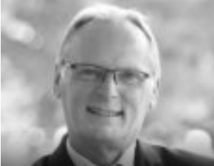
Jochen Homann Präsident, Bundesnetzagentur, sowie Mitglied des Kuratoriums, Forum für Zukunftsenergien e.V.