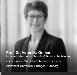
Prof. Dr. Veronika Grimm Inhaberin des Lehrstuhls für Volkswirtschaftslehre, insbesondere Wirtschaftstheorie, Friedrich-Alexander-Universität Erlangen-Nürnberg