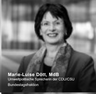
Marie-Luise Dött, MdB Umweltpolitische Sprecherin der CDU/CSU Bundestagsfraktion