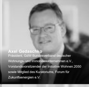
Axel Gedaschko Präsident, GdW Bundesverband deutscher Wohnungs- und Immobilienunternehmen e.V., Vorstandsvorsitzender der Initiative Wohnen 2050 sowie Mitglied des Kuratoriums, Forum für Zukunftsenergien e.V.