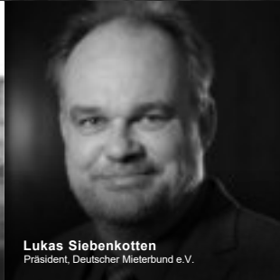
Lukas Siebenkotten Präsident, Deutscher Mieterbund e.V.