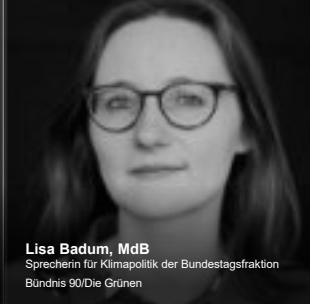
Lisa Badum, MdB Sprecherin für Klimapolitik der Bundestagsfraktion Bündnis 90/Die Grünen