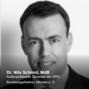
Dr. Nils Schmid, MdB Außenpolitischer Sprecher der SPD-Bundestagsfraktion, Minister a. D.