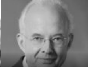
Prof. Dr. Dres. h.c. Paul Kirchhof Bundesverfassungsrichter a. D.