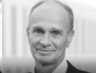
Wolfgang Langhoff Vorsitzender des Vorstandes, BP Europa SE