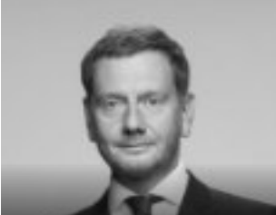
Michael Kretschmer Ministerpräsident des Freistaates Sachsen